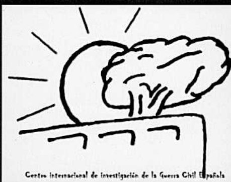
Centro Internacional de Investigación de la Guerra Civil Española